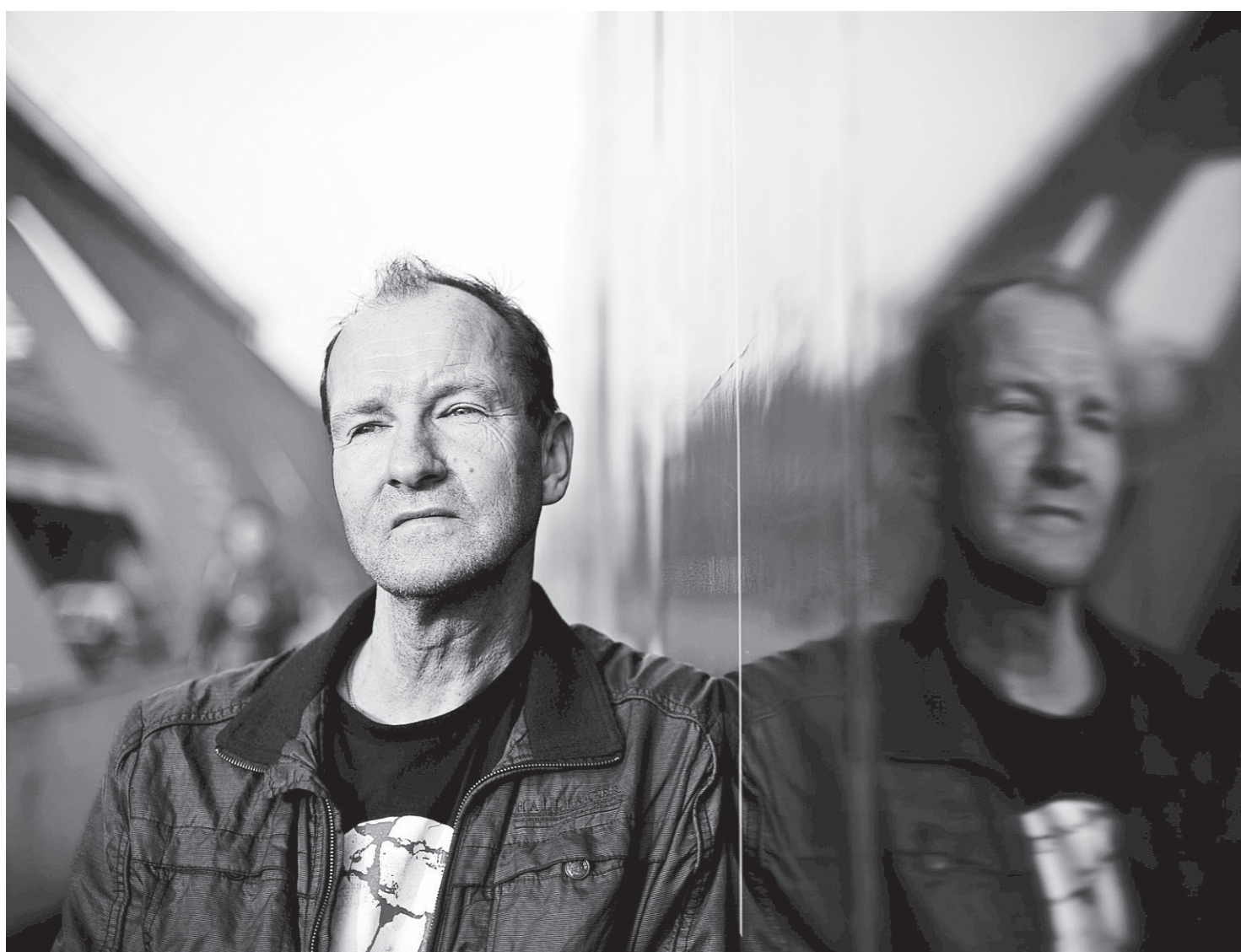
Singer/songwriter Wiem Zigtema.