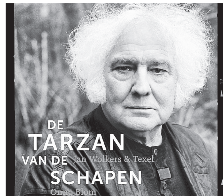
De omslag van het nieuwe boek.

„In het archief heb ik iets heel moois gevonden uit de jeugd van Wokers in Oegstgeest, waarvan een prachtig boek zou zijn te maken. Maar dat is dan ook de enige tussenstap die ik mij nog kan veroorloven. Daarna stoom ik op naar het Academiegebouw om op de biografie te gaan promoveren.”